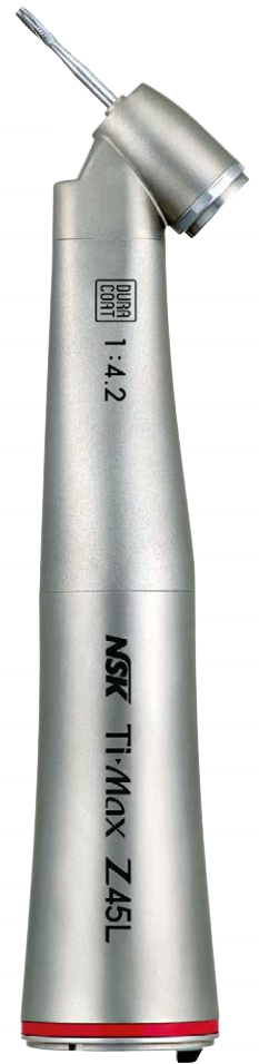
Ti-Max Z45L Licht-Winkelstück 1:4,2 Übersetzung Zwei-Wege-Sprayfunktion REF: C1064

Die Zwei-Wege-Sprayfunktion ermöglicht die individuelle Einstellung der Kühlung: je nach Bedingungen und Behandlung kann entweder Spraynebel oder eine Wasserstrahlkühlung (ohne Beimischung von Luft) ausgewählt werden.