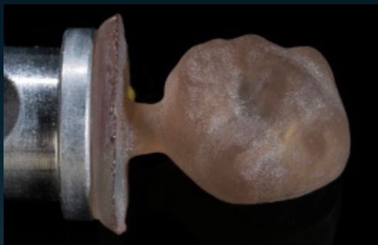
VITA SUPRINITY gefräst/Standard