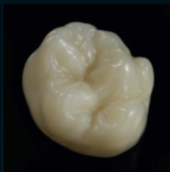
Ceramil Zolid Preshades gesintert/Ceramil HD