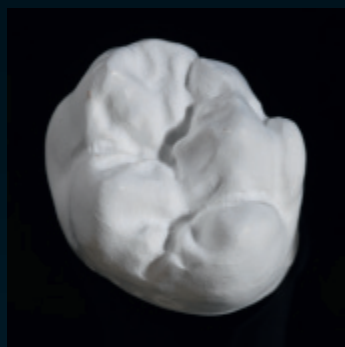
Ceramil Zolid Preshades gefräst/Ceramil HD