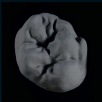
Ceramil Sintron gefräst/Ceramil HD