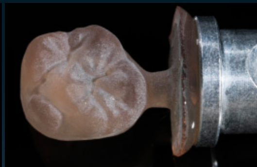
VITA SUPRINITY gefräst/Ceramil HD