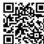
Bildergalerie Sirona auf der IDS 2013