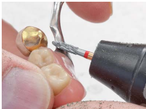
Abb. 1: Kleinere Korrekturen an Modellgussprothesen sind kein Problem für den H139UM (104.023).

Metall: Im Set TD1520A befinden sich für alle erdenklichen Metallkorrekturen zwei große Hartmetallfräser (Granate und Knospe schlank) und ein Piccolofräser (Torpedo). Die Hartmetallfräser für Edelmetall-, NEM- und Modellguss-Legierungen ermöglichen dank ihrer werkstoffgerechten Spezialverzahnung einen effektiven und wirtschaftlichen Materialabtrag. Wer die patentierten UM-Hartmetallfräser in den Händen hält, wird einen tollen Effekt erleben: Bei hoher Anpresskraft tragen sie großzügig ab, bei