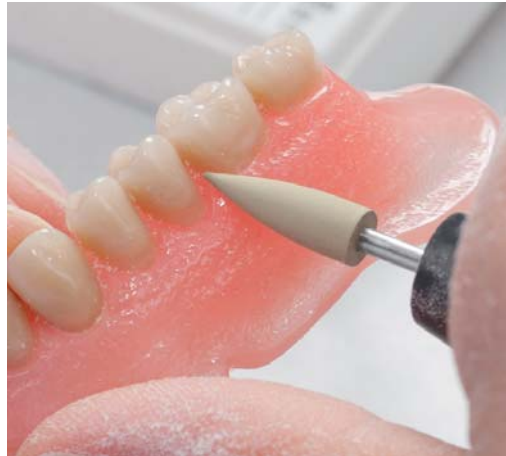
Abb. 4: Hochglanzfinish. Ganz gleich, ob Randbereiche oder interdental.