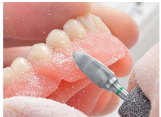
Abb. 2: Einkürzen der Ränder und Druckstellen entfernen an einer Kunststoffprothese.