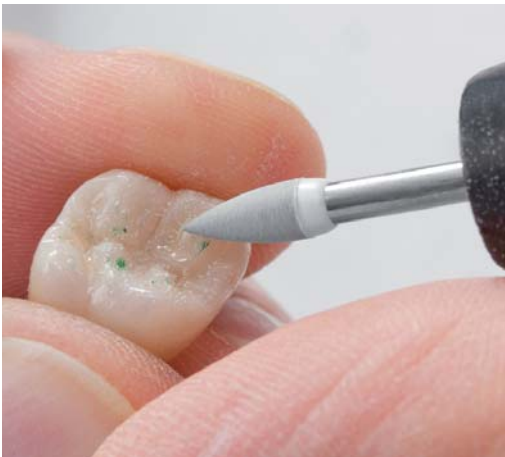
Abb. 5: Gezielt Frühkontakte entfernen...