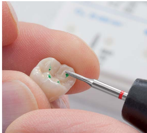
Abb. 6: ...und die anschließende Hochglanzpolitur.

geringer Anpresskraft entstehen feinere Oberflächen, die sich leicht polieren lassen. Gleichzeitig bieten sie eine große Laufruhe und lange Standzeit. Mit der anschließenden Politur (Torpedo und Rad) werden alle störenden scharfen Grate entfernt. Es gibt ein rundum gutes Gefühl, zu wissen, dass der Zahnarzt mit diesen Instrumenten alle Indikationen abdeckt!