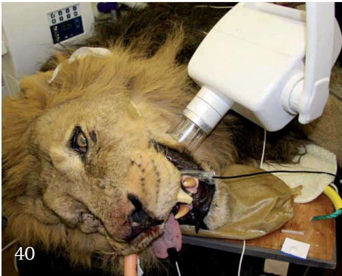
Zahnbehandlung eines Löwen – ein Fallbericht.