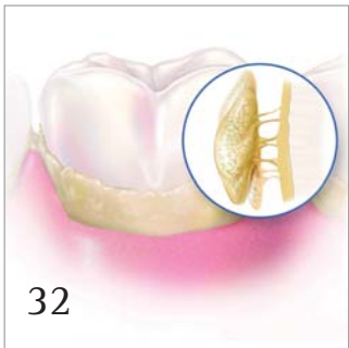
Wie man den Biofilm bekämpft.