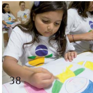
Kinderhilfsprojekt in Brasilien im Blick.