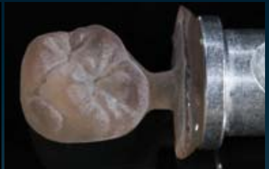
VITA SUPRINITY gefräst/Ceramil HD