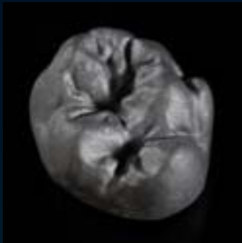
Ceramil Sintron gesintert/Ceramil HD