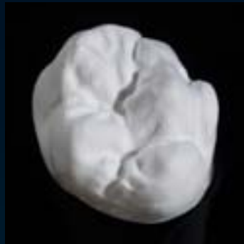
Ceramil Zolid Preshades gefräst/Ceramil HD