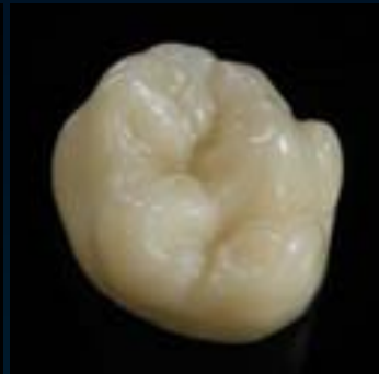
Ceramil Zolid Preshades gesintert/Ceramil HD