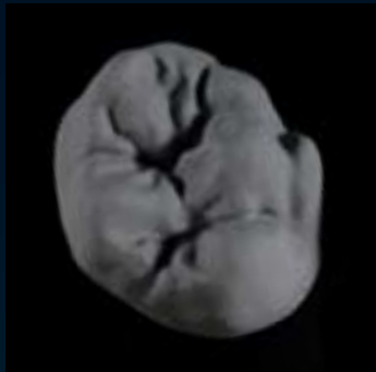
Ceramil Sintron gefräst/Ceramil HD