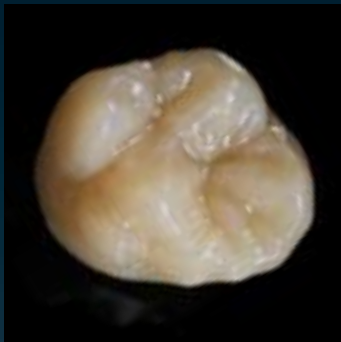
VITA SUPRINITY gesintert/Ceramil HD