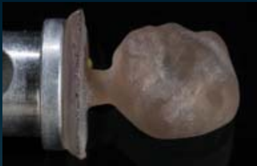
VITA SUPRINITY gefräst/Standard