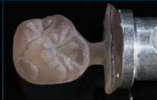
VITA SUPRINITY gefräst/Ceramil HD