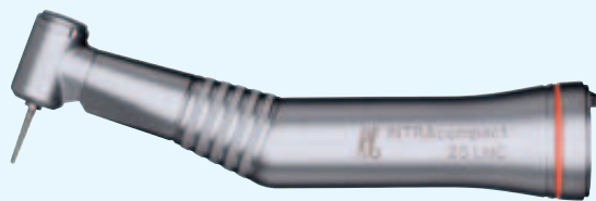
25 LHC Schnelllaufwinkelstück 1:5