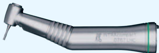
0767 LHC Winkelstück 5, 4:1