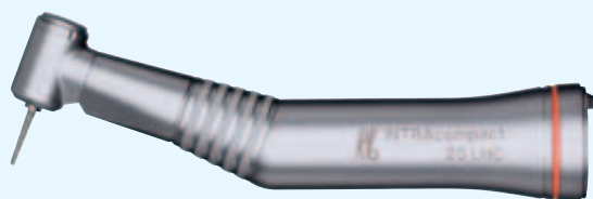
25 LHC Schnelllaufwinkelstück 1:5