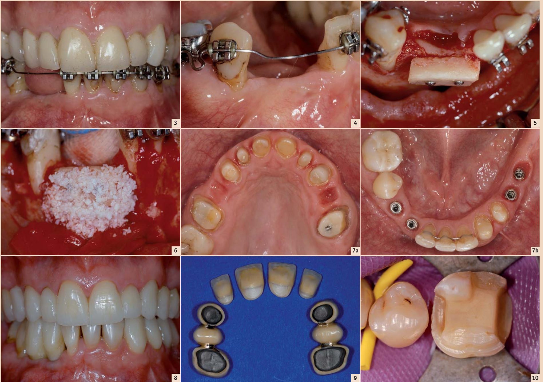
Abb. 3: Orthodontische Distalisation von Zahn 44. – Abb. 4: Bei der Reevaluation ist die Lücke ausreichend groß für die Insertion von zwei Implantaten. – Abb. 5: Knochenblock in situ. Anschließend werden die Ecken abgerundet. – Abb. 6: Der Knochenblock wird mit einem Knochenersatzmaterial bedeckt. – Abb. 7 a und b: Situation vor der finalen Abdrucknahme. – Abb. 8: Einprobe des Wax-up. – Abb. 9: Oberkiefer: Keramik-Einzelkronen und Metall-Keramik-Restorationen. – Abb. 10: Präparation von 46 für ein Presskeramik-Overlay.