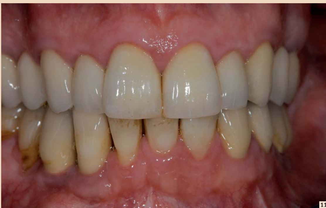
Abb. 11: Klinisch stabile Verhältnisse nach 6 Jahren.

Zahntechniker: ZTM Walter Gebhard (Labor Zürich)