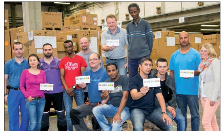
Geliebte Diversity bei Sirona: Am Standort Bensheim arbeiten Mitarbeiter aus 35 Nationen zusammen.

Unter dem Motto „Vielfalt unternehmen!“ beging Deutschland Anfang Juni den zweiten Diversity-Tag. Sirona beteiligte sich mit einer Ausstellung und einer Fotoaktion an den bundesweit rund 550 Aktionen, um auf die Bedeutung von Vielfalt in der Arbeitswelt aufmerksam zu machen.