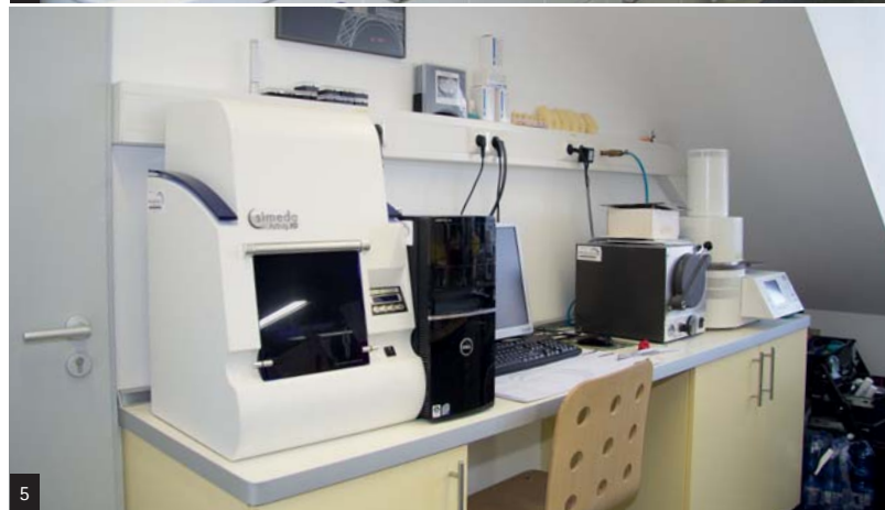
Abb. 3 und 4: Der Funktionsbereich sowie die Arbeitsvorbereitung sind die Dreh- und Angelpunkte des Labors. Abb. 5: Scanner- und CAD-Bereich.

räume integriert, die von beiden Seiten aktiv genutzt werden. Ein besonderes Highlight im Labor sind für mich immer noch die hohen Decken im Eingangsbereich und das freiliegende Gebälk. Die Einbettung des alten Holzes in die klaren, nüchternen Strukturen hatte mir bereits zu Beginn sehr gut gefallen und geben dem Labor eine gewisse Wärme.