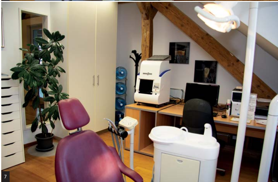
Abb. 6 und 7: Die Farbbestimmung und kleinere Nachkontrollen werden am Behandlungsstuhl vorgenommen.