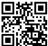
Marc M. Galal Infos zum Autor

Glaubenssätze begleiten unser Leben von unserer Kindheit an. Wir alle haben eine Vergangenheit. Entscheidend ist aber, sie nicht nur mit sich herumzutragen, sie nicht zu verleugnen oder gar zu unterdrücken. Nein, wichtig ist, die vorhandenen Glaubenssätze so zu modifizieren, dass sie Ihnen zukünftig nicht mehr Hindernis, sondern Hilfe sind – Hilfe, das zu tun, was sie wirklich tun möchten.