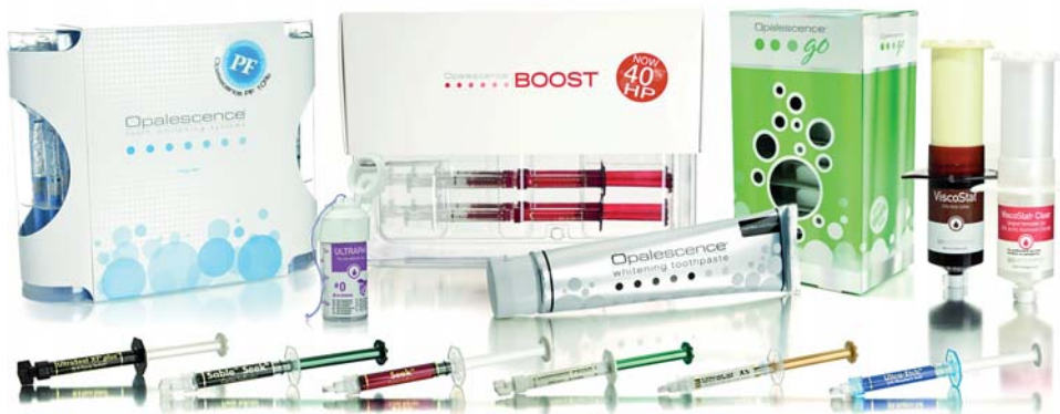
Ein kleiner Überblick über das umfangreiche Produktsortiment.

Die Prophylaxe bildet das Alpha und Omega einer ganzheitlichen Zahnbehandlung, und so unterstützt Ultradent Products diesen Bereich besonders durch ein gut durchdachtes Produktsortiment.