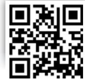
Ultradent Products Infos zum Unternehmen

Warum so viele Ansätze? Weil es so unterschiedliche und vielfältige Materialien gibt. Die Spezialisten von Ultradent Products werden jedem Material und Einsatzgebiet gerecht und machen so Routinearbeiten schnell, sicher und wirtschaftlich.