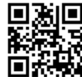
OPTI Zahnarztberatung GmbH Infos zum Unternehmen