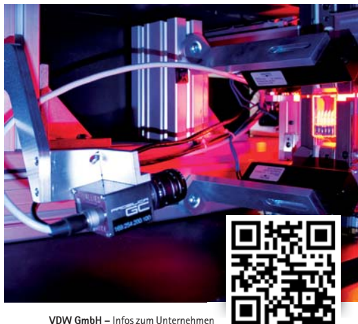
VDW GmbH – Infos zum Unternehmen

VDW GmbH Tel.: 089 62734-0 www.vdw-dental.com