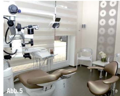
▲ Abb. 3 bis 5: Helle Farben und Naturtöne dominieren die Behandlungszimmer. Das Behandlungszimmer 3 besitzt ein Mikroskop für endodontische Eingriffe (Abb. 5). Um den Patienten die Möglichkeit des Ausruhens nach Eingriffen zu ermöglichen, wurde ein Zimmer mit Wellnessliege (Abb. 4) eingerichtet. Dieser Raum kann optional zu einem weiteren Behandlungszimmer gestaltet werden.

Kollegen überwiesen. Die Praxis an der Wallstraße verfügte jedoch über nur fünf Behandlungsräume und wurde unseren Kapazitäten einfach nicht mehr gerecht, eine Erweiterungsmöglichkeit gab es nicht. Wir hatten dort bereits verschiedene Modelle durchdacht, ob man zum Beispiel eine Satellitenpraxis eröffnet, uns letztendlich aber dafür entschieden, dass jeder seine eigene Praxis führt.