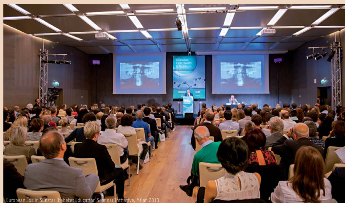
European Joslin Sunstar Diabetes Education Seminar Initiative, Milan 2013

Das Schlüsselement dieses Treffens ist der 360°-Ansatz des modernen Patientenmanagements, das den bedeutenden Zusammenhang zwischen