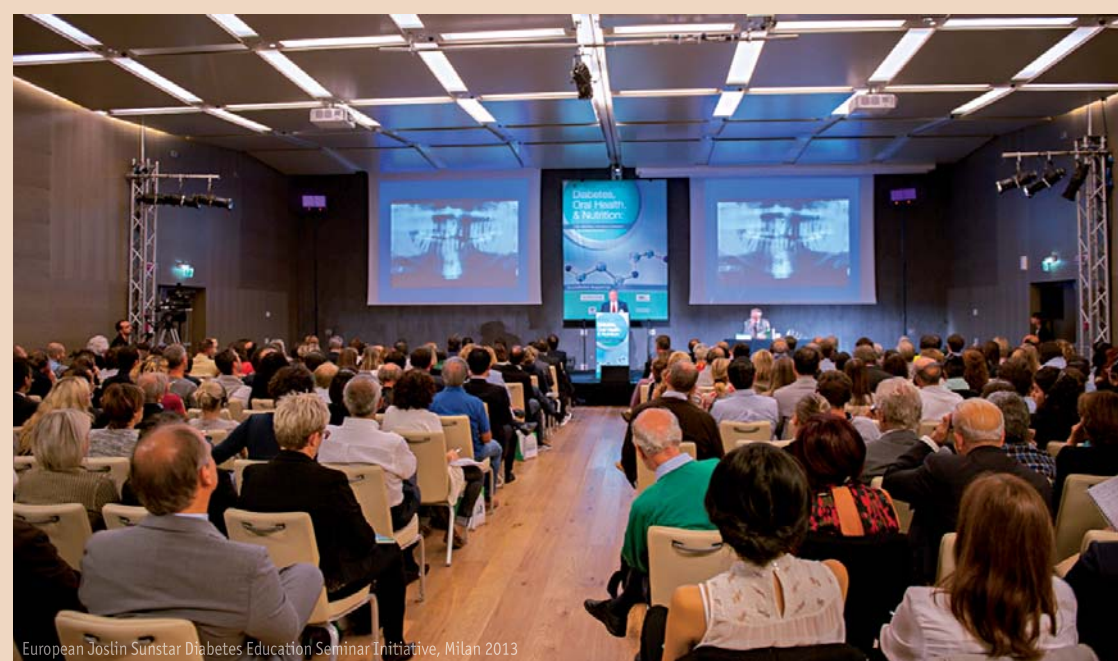
European Joslin Sunstar Diabetes Education Seminar Initiative, Milan 2013

Das Schlüsselement dieses Treffens ist der 360°-Ansatz des modernen Patientenmanagements, das den bedeutenden Zusammenhang zwischen