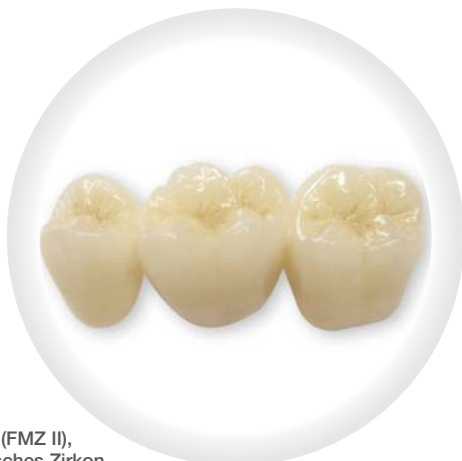
Vollzirkon (FMZ II), monolithisches Zirkon, hohe Transluzenz

129,-€ inkl. MwSt., zzgl. Modelle, Versand und evtl. benötigter Implantatteile