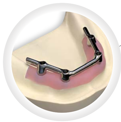
Gefräster Steg aus Co/Cr auf vier Implantaten, inkl. individueller Abutments

1. Glied 105,-€ Jedes weitere 80,-€ inkl. MwSt.