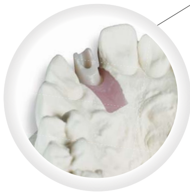
Individuelles Zirkonabutment, verklebt auf Titanbasis

1. Glied 120,-€ Jedes weitere 100,-€ inkl. MwSt.