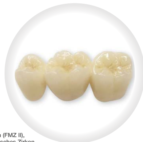
Vollzirkon (FMZ II), monolithisches Zirkon, hohe Transluzenz

129,-€ inkl. MwSt., zzgl. Modelle, Versand und evtl. benötigter Implantatteile