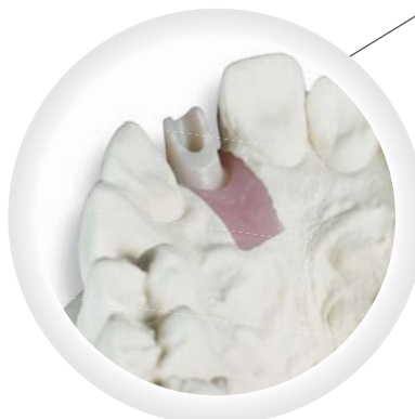
Individuelles Zirkonabutment, verklebt auf Titanbasis

1. Glied 120,-€ Jedes weitere 100,-€ inkl. MwSt.