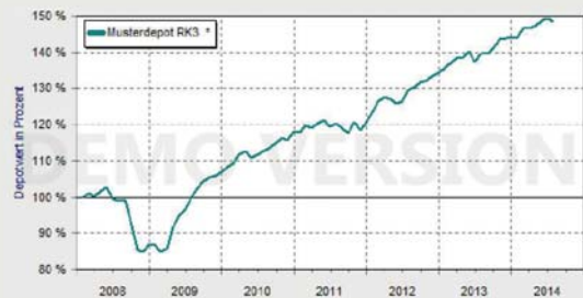
Wertentwicklung des Musterdepots seit 2/2008.

Als ich mir den Superfonds genau ansah, stellte ich fest, dass der Fonds zwar am 1.8.2008 aufgelegt worden war, aber die üblichen Charts aus dem Web erst in 2009 begannen. Das heißt, im Gegensatz zum Musterdepot enthielten diese Charts die Finanzkrise 2008 überhaupt nicht! Außerdem kann man davon ausgehen, dass ein Fonds, der im August 2008, also mitten in der Finanzkrise, aufgelegt wird, nicht mit Vollgas investiert, sondern erst mal langsam macht. Ich konnte deshalb davon ausgehen, dass der Fonds im Grunde am Tiefpunkt der Finanzkrise startete und nur die Aufwärtsbewegung mitgemacht hatte. Aufschlussreich