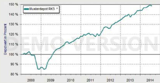
Wertentwicklung des Musterdepots seit 2/2008.

Als ich mir den Superfonds genau ansah, stellte ich fest, dass der Fonds zwar am 1.8.2008 aufgelegt worden war, aber die üblichen Charts aus dem Web erst in 2009 begannen. Das heißt, im Gegensatz zum Musterdepot enthielten diese Charts die Finanzkrise 2008 überhaupt nicht! Außerdem kann man davon ausgehen, dass ein Fonds, der im August 2008, also mitten in der Finanzkrise, aufgelegt wird, nicht mit Vollgas investiert, sondern erst mal langsam macht. Ich konnte deshalb davon ausgehen, dass der Fonds im Grunde am Tiefpunkt der Finanzkrise startete und nur die Aufwärtsbewegung mitgemacht hatte. Aufschlussreich