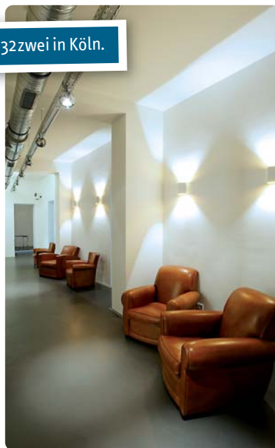
Abb. 7: Wartelounge.