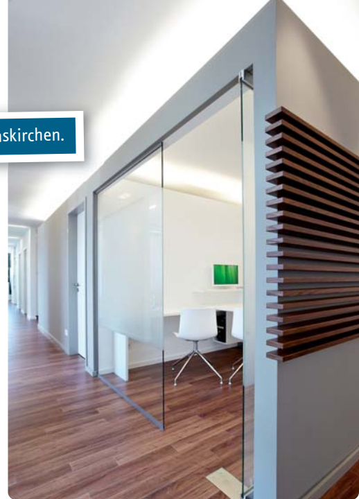
Abb. 5: Funktionalität en détail.

sicherheit, weil uns das Investitionsbudget bekannt ist, das Fremdanbieter zuvor meist außer Acht ließen. So sind uns kreative und gleichzeitig kostenbewusste Lösungen möglich.