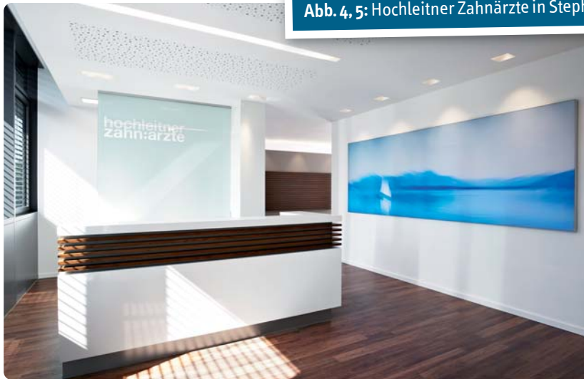
Abb. 4, 5: Hochleitner Zahnärzte in Stephanskirchen.