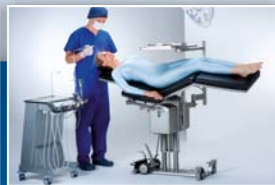
OPERIEREN AUF IHREM LEVEL