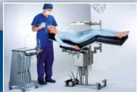
OPERIEREN AUF IHREM LEVEL