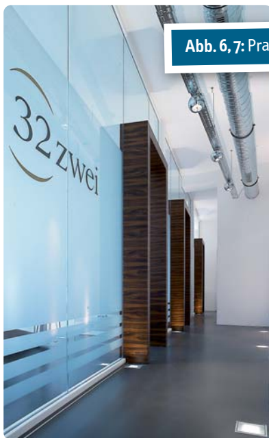
Abb. 6, 7: Praxis 32zwei in Köln.

Wir vereinbaren generell einen ersten unverbindlichen Gesprächstermin in unserem Büro, die nachfolgenden Termine finden jeweils an Orten nach Kundenwunsch statt. Und soll das erste Treffen schon mehr werden als ein persönliches Kennenlernen und gibt es bereits eine Wunschimmobilie, empfehle ich, falls vorhanden, schon vorab Architektenpläne zur Verfügung zu stellen, die es mir ermöglichen, schon vorab einen komplexeren Eindruck der Räumlichkeiten zu gewinnen. Schnell lässt sich so bereits im Vorfeld klären, ob die Räume überhaupt für eine Praxis geeignet sind, und auch, ob die gewünschte Anzahl an Behandlungsbereichen unterzubringen ist. Wichtig ist, die Bedürfnisse der Kunden wirklich zu erfassen.