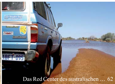
Das Red Center des australischen ... 62