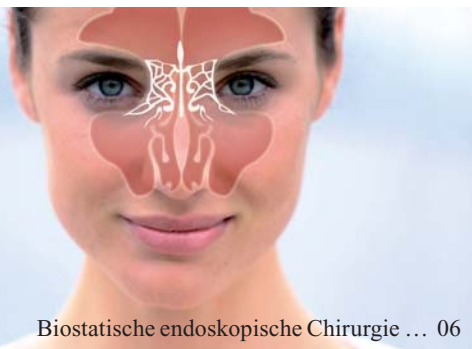
Biostatistische endoskopische Chirurgie ... 06