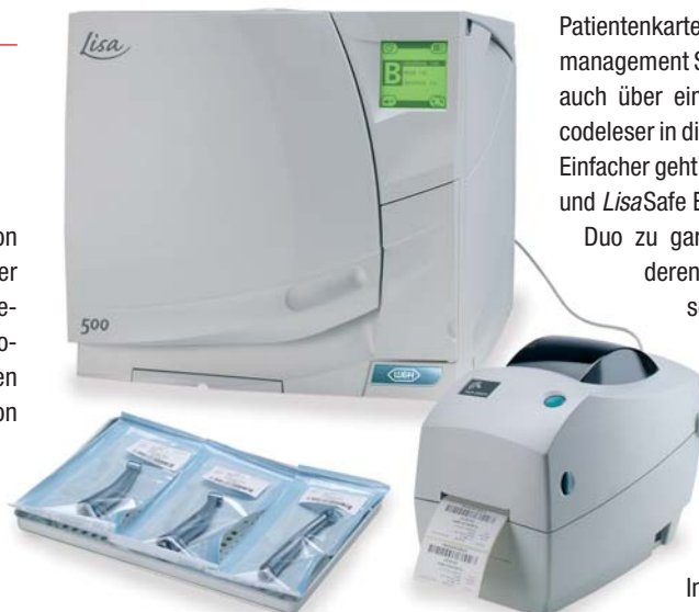
LisaSafe: fehlerlose Dokumentation.

Tel.: 0 25 04/9 32 23 00 E-Mail: Info@aesthetico.de www.aesthetico.de