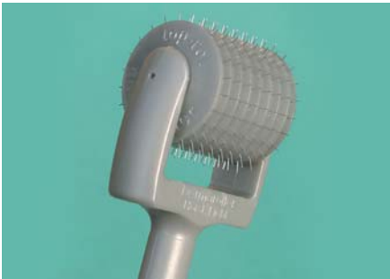
Der Dermaroller MF 8. Ausgestattet mit 192 Nadeln mit einer Länge von 1,5 mm.

Microneedling mit dem Dermaroller® stellt eine neue, minimalinvasive perkutane Collagen-Induktions-Therapie (CIT) im Bereich der ästhetischen Medizin dar. Die Anwendung des Dermarollers® mit bis zu 192 feinen Nadeln aus geschliffenem Chirurgenstahl setzt eine Wundheilungs-