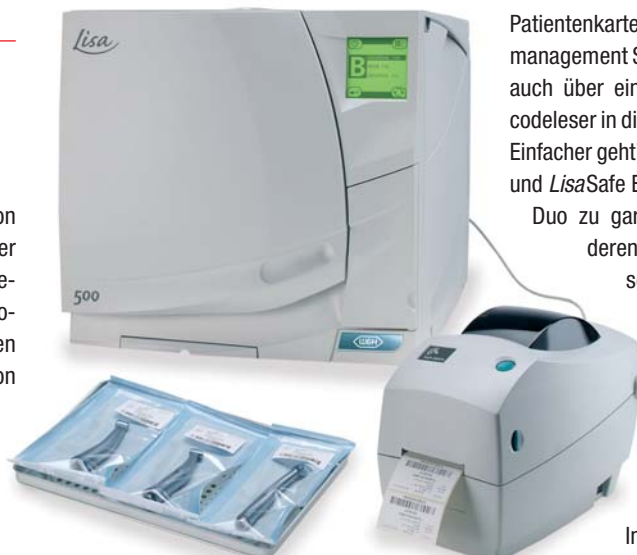
LisaSafe: fehlerlose Dokumentation.

Tel.: 0 25 04/9 32 23 00 E-Mail: Info@aesthetico.de www.aesthetico.de