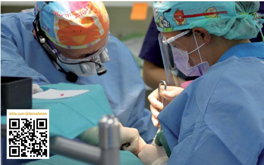
Die Beiträge in dieser Rubrik stammen von den Herstellern bzw. Vertreibern und spiegeln nicht die Meinung der Redaktion wider.

Nobel Biocare Deutschland GmbH Tel.: 0221 50085-0 www.nobelbiocare.com