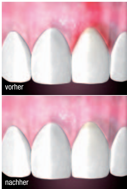
Die Anwendung von PERIOSYAL ® SHAPE im Vorher-Nachher-Vergleich.

ner Hebung des Zahnfleisches. Die Ergebnisse sind nach 1–3 Wochen sichtbar. Für beide Produkte wird die Technologie des Resilient Hyaluronic Acid ™ genutzt. Das Gel steigert Wundheilungsprozesse, besitzt eine hohe Kohäsivität und ist optimal kreuzvernetzt, verbindet sich dadurch mit dem umliegenden Gewebe und verlängert den Effekt der Behandlung.