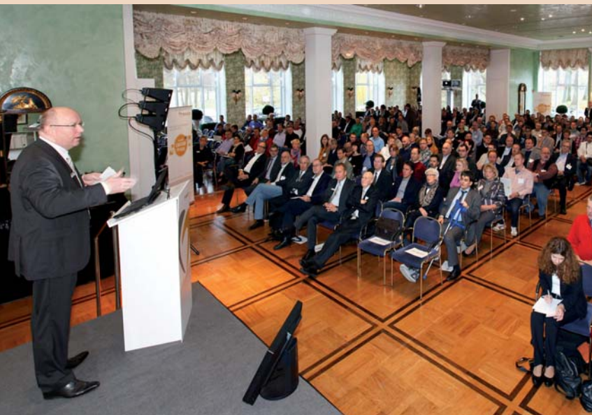
Den vergangenen IMCC-Kongress besuchten rund 350 Teilnehmer aus dem gesamten Bundesgebiet und Österreich.