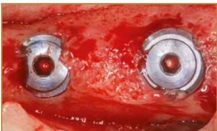
Innenliegende Deckschraube und Knochenüberlagerung an der Implantatschulter bei Freilegung