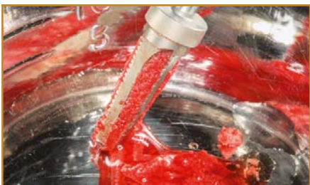
Mehrfachbohrer mit Sammelkammer für autologes Knochenmaterial