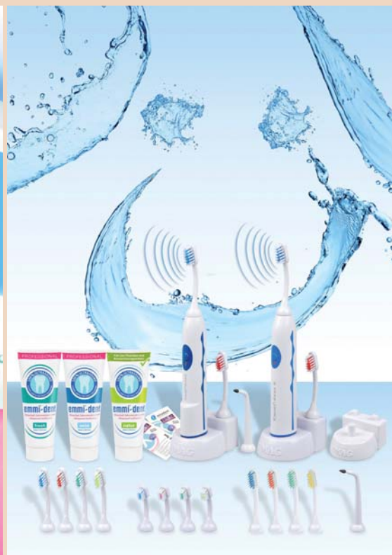
Abb. links: Wirkung der Ultraschallzahnbürste. – Abb. rechts: Emmi-dent Ultraschallzahnbürste und Spezialzahncreme.