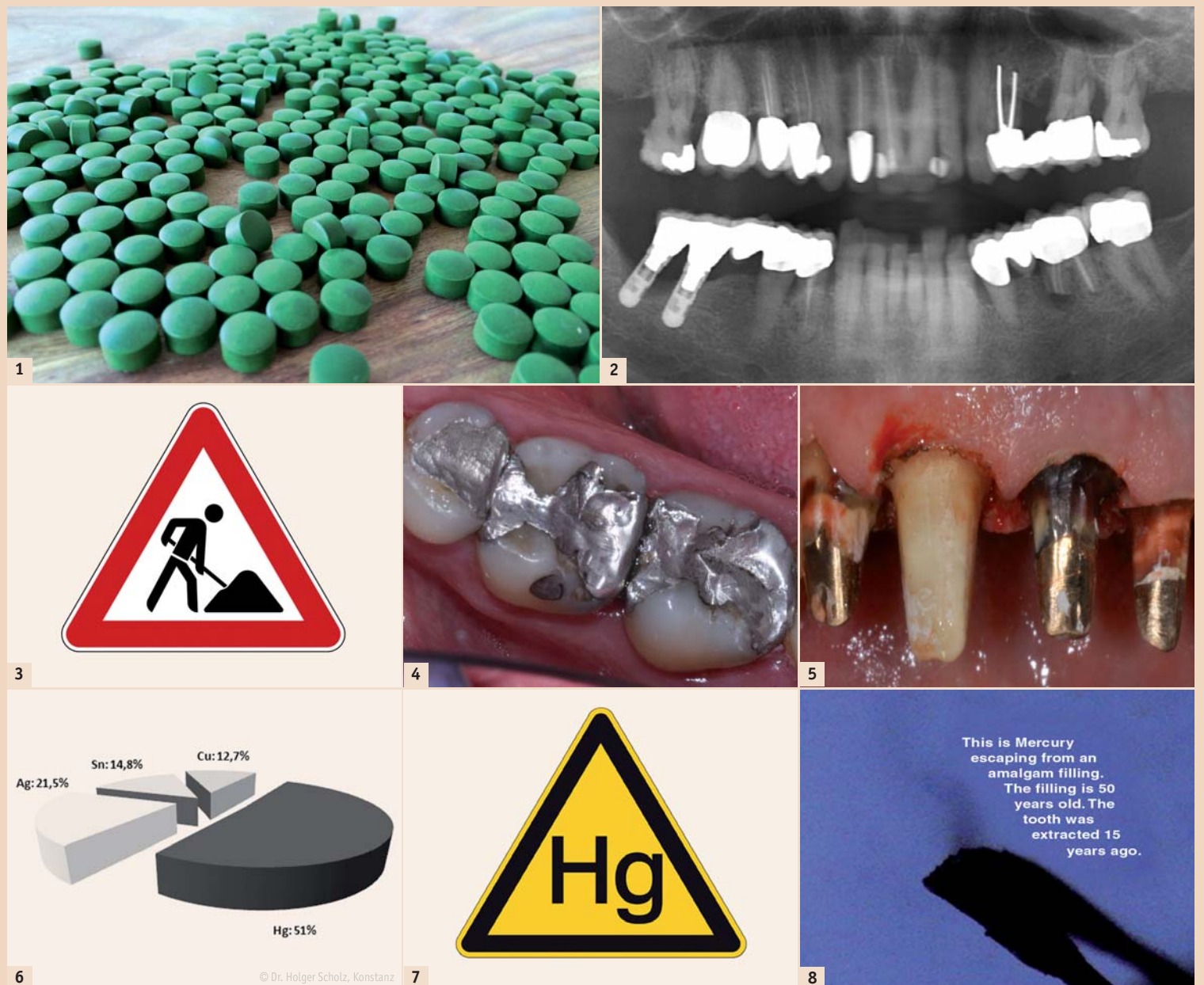
Abb. 1: Chlorella; Detoxwunder aus der Natur. – Abb. 2 und 3: Standard-Panoramröntgenaufnahme: Grossbaustelle für die Gesundheit. – Abb. 4 und 5: Alte Amalgamfüllungen und Metallstifte. – Abb. 6 und 7: Exemplarische Zusammensetzung einer Amalgamfüllung: 51% Quecksilber (Hg), 21,5 % Silber (Ag), 14,8 % Zinn (Sn) und 12,7 % Kupfer (Cu) (nach Herstellerangaben). – Abb. 8: www.uninformedconsent.org: Hg-Dampf aus 50 Jahre alter Füllung – dargestellt unter fluoreszierendem Licht.

Für verschiedene Metalle wie Quecksilber, Gold, Platin, Kupfer,