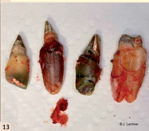
Abb. 9: Quecksilberdampf aus Amalgamfüllungen kann in Verbindung mit bakteriellen Biotoxinen zu hochgiftigen Supertoxinen (Dimethylquecksilber) mutieren. – Abb. 10 und 11: Klassisches Szenario: Goldkrone neben Amalgamfüllung – der Batterieeffekt. – Abb. 12 und 13: Wurzelbehandelte Zähne auf dem Röntgenbild und in natura. Totes Gewebe hinterlässt seine Spuren.