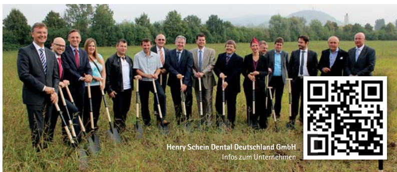
Henry Schein Dental Deutschland GmbH Infos zum Unternehmen

Henry Schein Dental Deutschland GmbH Tel.: 0800 1400044 www.henryschein-dental.de