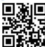
ACTEON Germany GmbH Infos zum Unternehmen

ACTEON Germany GmbH Tel.: 02104 9565-10, www.de.acteongroup.com