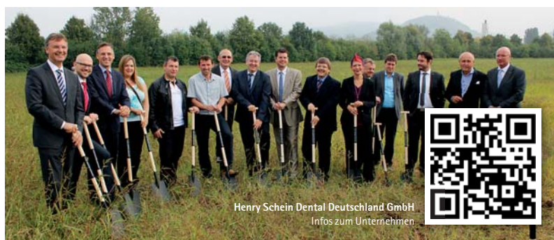
Henry Schein Dental Deutschland GmbH Infos zum Unternehmen

Henry Schein Dental Deutschland GmbH Tel.: 0800 1400044 www.henryschein-dental.de