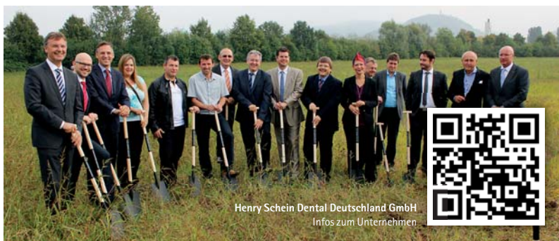
Henry Schein Dental Deutschland GmbH Infos zum Unternehmen