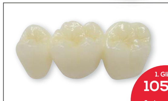
Vollzirkon (FMZ II) monolithisches Zirkon hohe Transluzenz