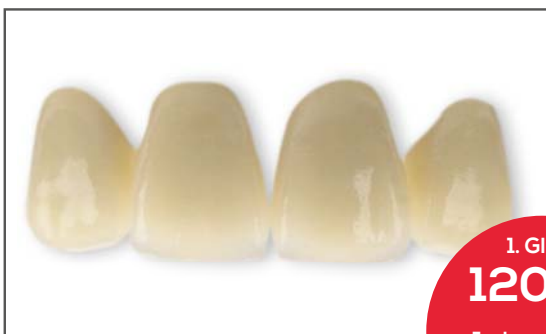
Zirkon (Calypso) vollverblendet hervorragende Ästhetik