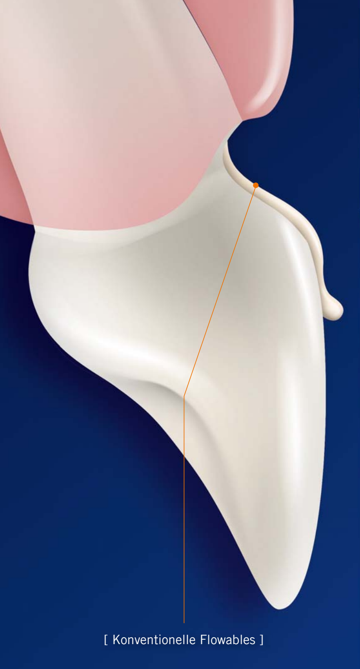
[ Konventionelle Flowables ]