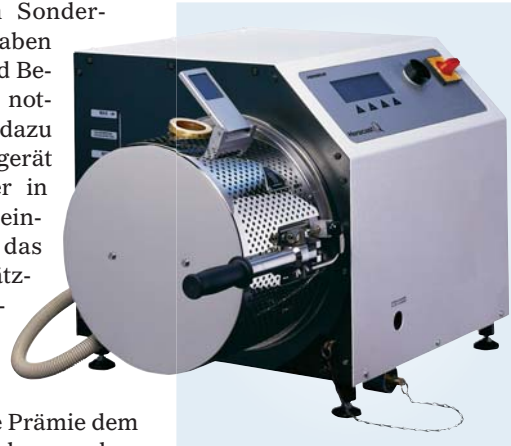
Das induktiv beheizte Vakuum-Druck-Gießgerät Heracast iQ von Heraeus Kulzer mit integrierter Vakuumpumpe und Wasserkühlung.

Wunschgerät zum Sonderpreis. Weitere Angaben sind im Bestell- und Bezahlvorgang nicht notwendig. Parallel dazu sendet es sein Altgerät an Heraeus Kulzer in Hanau. Bei Wareneingang verrechnet das Unternehmen zusätzlich zum Aktionspreis eine vom Gerätetyp abhängige Abwrackprämie. Alternativ kann die Prämie dem Kunden gutgeschrieben werden.