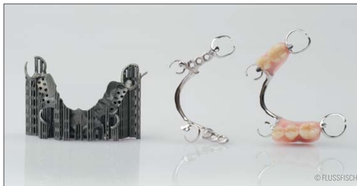
Herausnehmbarer Zahnersatz per digitaler Modellguss-Technologie in drei Prozessschritten.