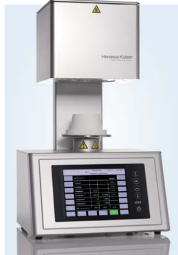
Austromat 624: Der Keramikbrennofen für präzise und gleichbleibende Ergebnisse ist eines von sieben Geräten, die es bis 15. Dezember 2014 zum Aktionspreis gibt.

Hersteller – und schreibt dem Kunden eine Abwrackprämie von bis zu 1.000 Euro gut. So funktioniert es: Das Labor bestellt bis 15. Dezember 2014 das