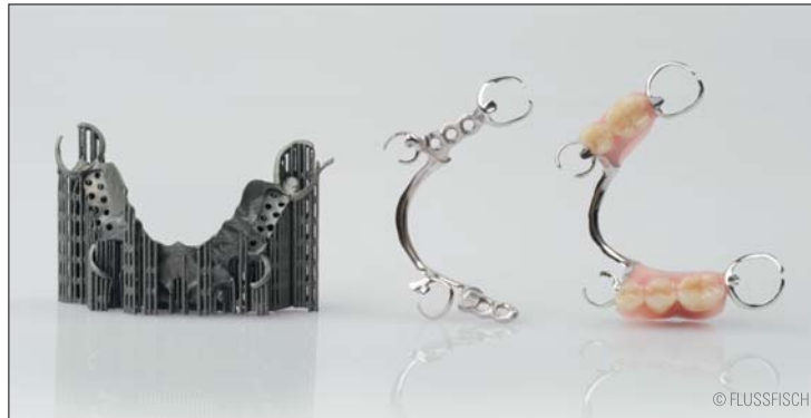
Herausnehmbarer Zahnersatz per digitaler Modellguss-Technologie in drei Prozessschritten.