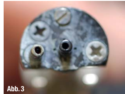
▲ Abb. 3: Biofilm und Kalkablagerungen an der Luft-Wasser-Spritze.

Durch umfangreiche Umbauten an der Hausinstallation wie z.B. den Rückbau von Stich- und Totleitungen, die Erneuerung der Sicherheitsgruppe am Warmwasserspeicher, die Stilllegung eines überflüssigen Boilers und den Einbau neuer Probeentnahmeventile an den Kaltwasser- und Warmwasserverteilern sowie der Ringleitung zum Speicher, wurde die Trinkwasserinstallation gemäß dem Stand der Technik so weit wie möglich optimiert. Zur Erhöhung der Durchflüsse wurden im zentralen Wasserverteiler im zweiten Obergeschoss zeitgesteuerte Magnetventile installiert. Darüber hinaus wurden noch die Armaturen in einigen Zimmern ausgetauscht wie auch die Magnetventile repariert, um das Eindringen des Warmwassers in die Behandlungseinheiten künftig zu verhindern. Neben diesen umfangreichen baulichen Maßnahmen wurde das vorhandene Wassersicherheitskonzept neu auf Basis eines BLUE SAFETY SAFEWATER