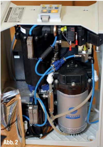
▲ Abb. 2: Freier Auslauf gemäß DIN EN 1717.

BLUE SAFETY zur endgültigen Sanierung der Klinik. Durch eine gründliche technische Bestandsaufnahme der Hausinstallation, die Überprüfung von früheren Befunden sowie einer systematischen Eingrenzung der Problemquellen durch eine strategische Probenahme seitens BLUE SAFETY, konnte ein umfassendes Lagebild erstellt werden, um gezielt handeln zu können.