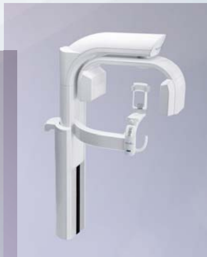
Panorama- und 3D-Bildgebung