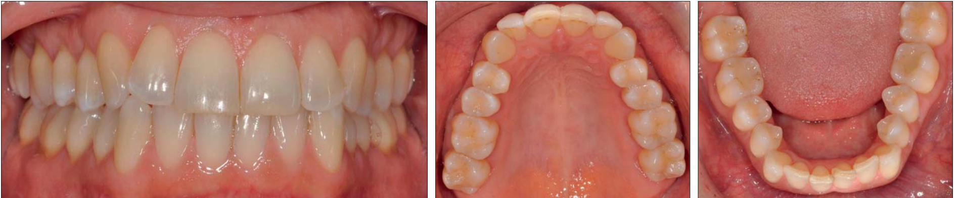
Abb. 1: Ausgangssituation der abzuförmenden Kiefer: Es sollen kieferorthopädische Planungsmodelle hergestellt werden. – Abb. 2: Oberkiefer: Es sind frontale Engstände und Rotationen zu erkennen. – Abb. 3: Unterkiefer: Auch hier liegen verschiedene Rotationen und Engstände vor.