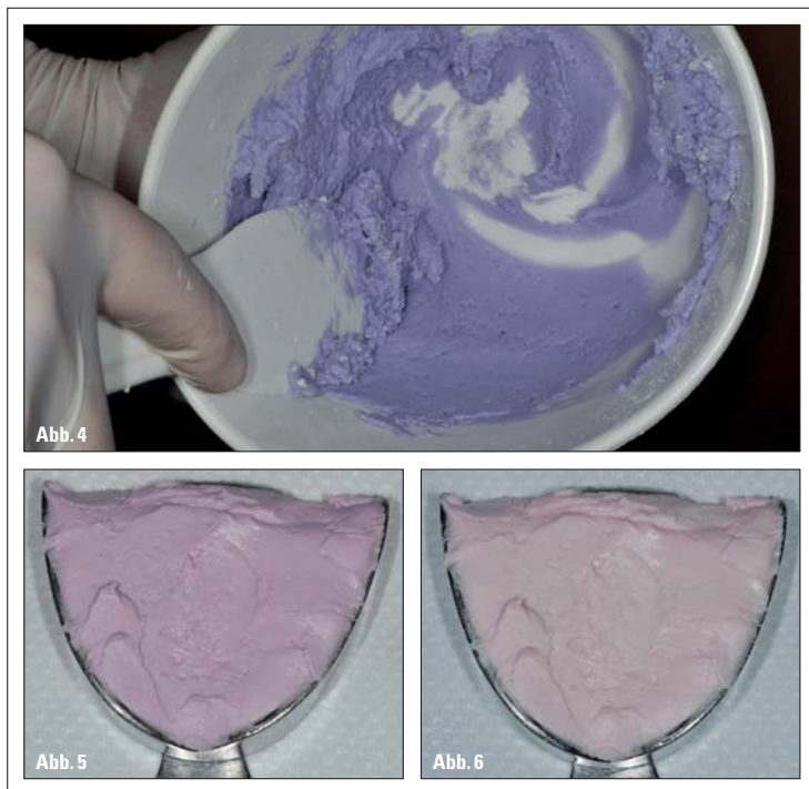
Abb. 4: Xantalgin Crono wird im vorgegebenen Verhältnis mit Wasser gemischt. Zu Beginn des Mischens ist das Alginat blau. – Abb. 5: Solange Xantalgin Crono violett ist, kann es in den Abformlöffel gegeben werden. – Abb. 6: Geht die Farbe von Xantalgin Crono von Violett in Rosa über, sollte das Material spätestens in den Mund eingebracht werden.