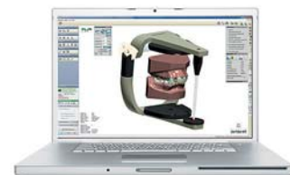
OrthoAnalyzer™ Analyse Software, virtuelle Behandlungsplanung

Als Pionier und Spezialist im Bereich der digitalen Anwendungen stehen wir Ihnen als starker Partner zur Seite. www.dimension-orthodontics.de