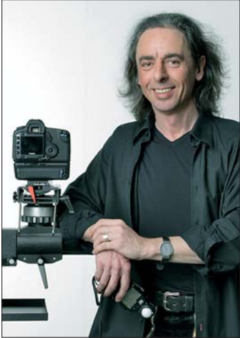
Optimal gelungene Patientenaufnahmen sind das A und O einer guten Falldokumentation. Fotograf Erhard J. Scherpf zeigt am 5. Dezember 2014 in Kassel, wie es geht.

FORESTADENT Kurs mit Erhard J. Scherpf vermittelt komplettes Wissen von A bis Z rund um die professionelle Dental fotografie.