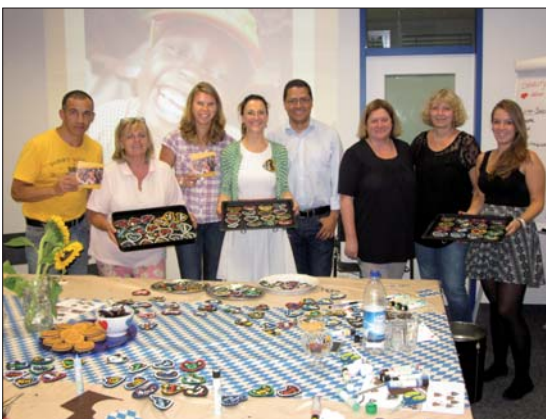
GAC-Mitarbeiter bastelten im Vorfeld der DGKFO-Tagung rund 200 Filzherzen, die zum Münchener Jahreskongress dann zugunsten der medizinischen Versorgung eines kenianischen Dorfes verkauft wurden.

Erfolgreiche Spendenaktion von DENTSPLY GAC auf der DGKFO-Tagung.