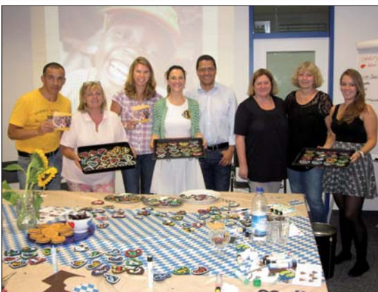
GAC-Mitarbeiter bastelten im Vorfeld der DGKFO-Tagung rund 200 Filzherzen, die zum Münchener Jahreskongress dann zugunsten der medizinischen Versorgung eines kenianischen Dorfes verkauft wurden.

Erfolgreiche Spendenaktion von DENTSPLY GAC auf der DGKFO-Tagung.