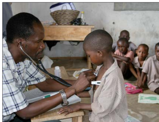
Mit dem Erlös der Aktion kann die medizinische Versorgung der Kinder in Kidzangoni für mehr als sieben Monate sichergestellt werden.

„Spatzi“, „Mausi“, „Bazi“ – eine ganz besondere Wohltätigkeitsaktion hatte sich DENTSPLY GAC für die diesjährige DGKFO-Jahrestagung in München ausgedacht: An seinem Messestand bot der Marktführer bei selbstligierenden Brackets die weltbekannten Oktoberfesterherzen an – allerdings nicht aus Lebkuchen, sondern aus Filz. Mithilfe der bayerischen Kunstwerke verbessert sich die medizinische Versorgung eines afrikanischen Dorfes. Eine Spendenaktion mit den