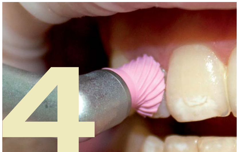
Abb. 4: Mit den Young Polierkappen ist ein effizientes und substanzschonendes Arbeiten möglich.

Abb. 3: Durch die Anpassungsfähigkeit der Polierkappen kann ausreichend Paste an der Zahnoberfläche gehalten werden.