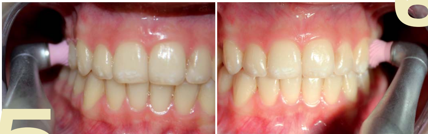
Abb. 5 und 6: Das ergonomische Design des Proxeo Winkelstückes unterstützt effizientes Arbeiten selbst bei beengten Platzverhältnissen.

führung. Diese hat den Vorteil, besonders schonend im empfindlichen Bereich des Sulkus zu polieren. Die Polierkappe spreizt sich weit auf und schmiegt sich auch bei sehr konkaven Zahnoberflächen sowie im Bereich der Zahnhäse besonders gut an.