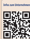
Infos zum Unternehmen