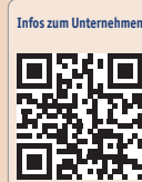
Infos zum Unternehmen