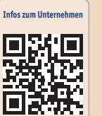
Infos zum Unternehmen