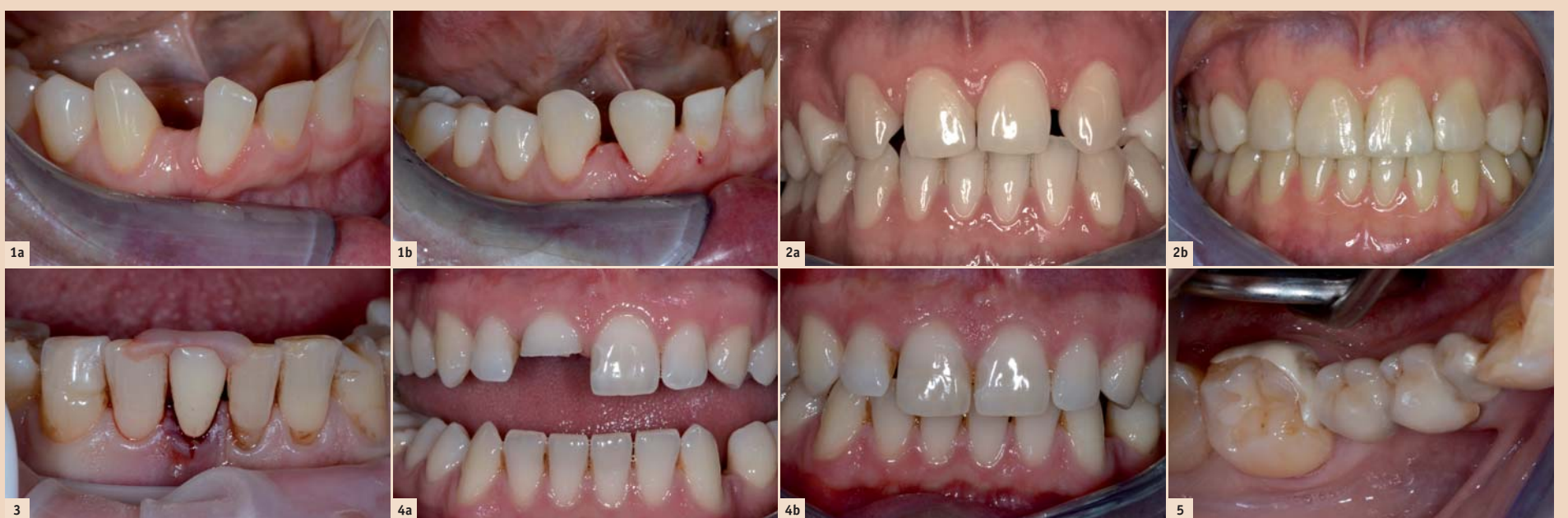
Abb. 1a: Die Patientin stört sich an der großen Lücke zwischen 43 und 42. Sie wünscht eine Lückenverkleinerung, hat aber nur eingeschränkte finanzielle Möglichkeiten. – Abb. 1b: Additive Zahnverbreiterung mit Komposit bei 43 mesial und 42 distal. – Abb. 2a: Junge Patientin (<30 Jahre) mit Nichtanlagen von 12 und 22. Wünscht ästhetische Verbesserung in relativ kurzer Zeit, da Auslandsaufenthalt ansteht (keine Kieferorthopädie und Implantation möglich). – Abb. 2b: Additive Zahnverbreiterung mit Komposit und Umgestaltung der Eckzähne zu seitlichen Schneidezähnen sowie der ersten Prämolaren zu Eckzähnen. – Abb. 3: Positionierschlüssel aus Kunststoff für 41, welcher nach Exzision mittels glasfaserverstärktem Komposit an den Nachbarzähnen befestigt werden soll. Genau gleich können auch Positionierschlüssel für Fragmente hergestellt werden. – Abb. 4a: Der Patient hat ein Frontzahntrauma (Kronenfraktur ohne Pulpabeteiligung) bei Zahn 11 erlitten. – Abb. 4b: Das Reattachment konnte dank des aufgefundenen Fragmentes sehr gut durchgeführt werden. Die „Restauration“ ist nahezu unsichtbar. – Abb. 5: Zirkoninlaybrücke von alio loco. Der linguale Adhäsivflügel ist lose. Zudem ist die Gerüstgestaltung lingual bis weit zum Margo gingivae geführt, sodass es zu einer chronischen Entzündung der Gingiva kommt.

Je nach Situation kann das Kompositmaterial frei Hand geschichtet werden (Abb. 1a und b), oder man kann sich mithilfe der Formgestaltung erleichtern. Die Vorteile der rein additiven Formveränderung liegen auf der Hand: Die Veränderung ist reversibel und kann bei Nichtgefallen jederzeit geändert werden. Kommt es zu einem etwaigen Misserfolg, kann die Restauration einfach repariert werden. Gerade bei umfassenden Formveränderungen von Zähnen (z.B. bei Nichtanlagen) kann es sinnvoll sein, zunächst die Zähne mit Komposit zu versorgen und die Situation einige Jahre zu belassen, bevor dann später mit Keramikschalen die Zähne „definitiv“ versorgt werden (Abb. 2a und b). Mit diesem Vorgehen kann sich der Patient an das neue „Lächeln“ gewöhnen, und die Kompositfüllungen dienen als Vorlage für die definitive Gestaltung der Keramikarbeiten. ➔