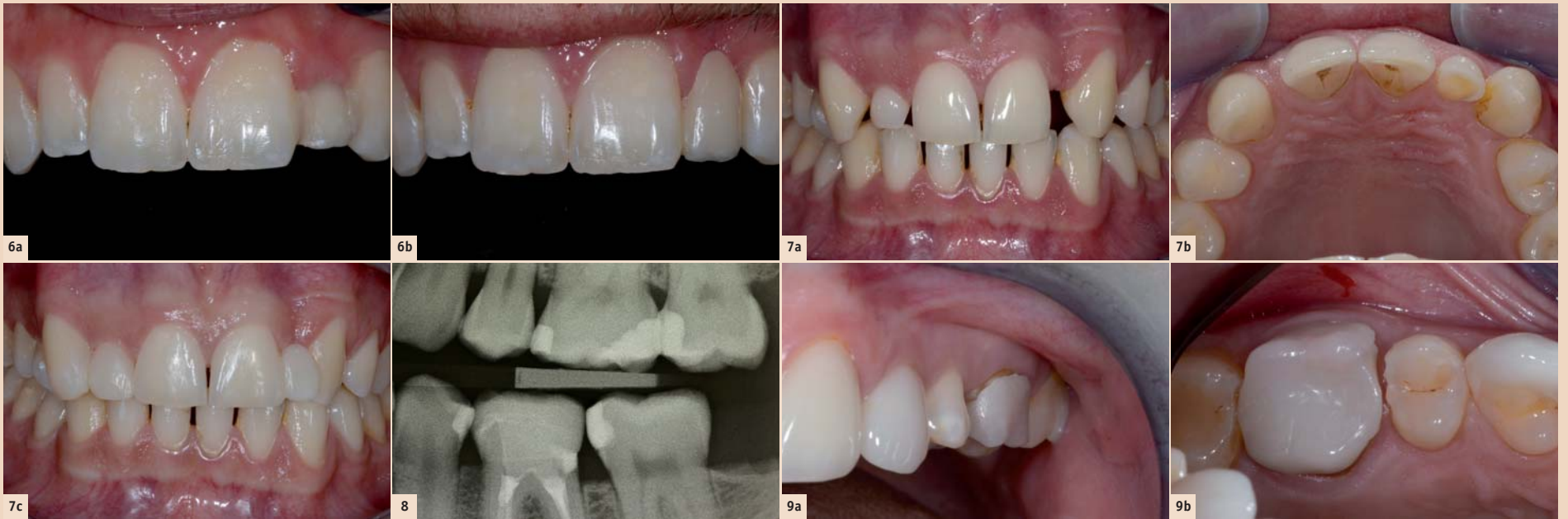
Abb. 6a: Marylandbrücke für 22 von alio loco. Der Zahnersatz wirkt zu kurz und es kommt immer wieder zu Dezentrierungen der beiden Adhäsivflügel. – Abb. 6b: Die neue vollkeramische Klebebrücke ist nur noch einflügelig an 21 befestigt. Die Ästhetik ist auf Sprechdistanz sehr ansprechend. – Abb. 7a: Der Patient hat Nichtanlagen der seitlichen Schneidezähne. Dabei ist Milchzahn 52 in situ, während 62 nicht vorhanden ist. Der Patient ist in der Ausbildung und hat nur wenig finanzielle Mittel zur Verfügung. Eine kieferorthopädische Behandlung oder eine teure Sanierung kann sich der Patient nicht leisten. – Abb. 7b: Die asymmetrische Lückenverteilung und vor allem das enge Platzangebot bei der Lücke Regio 22 ist in der Palatinalansicht besonders deutlich. – Abb. 7c: Die Situation wurde so gelöst, dass 11 und 21 additiv nach distal und 13 nach mesial verbreitert wurden. Auch 52 wurde rein additiv verbreitert und verlängert. In Regio 22 wurde eine direkte faserverstärkte Kompositbrücke gemacht mit Attachment palatinal 21. Problematisch war das sehr enge Platzangebot, weshalb Zahn 22 nach distal außen rotiert modelliert werden musste. Sicherlich ist es ästhetisch nicht perfekt gelöst, aber die Situation ist für den Patienten zurzeit zufriedenstellend. Großer Vorteil der Behandlung ist, dass die ganze Versorgung rein additiv erfolgte und nichts präpariert wurde. Der Termin für die Dentalhygiene war noch ausstehend! – Abb. 8: Röntgenbild einer CEREC-Endkrone bei 36 aus Keramik. Deutlich zeichnet sich die PBE distal ab. Die Situation ist seit 6 Jahren stabil. Erkennbar ist das Knochenremodelling: Das Knocheniveau von 36 ist distal niedriger als mesial. – Abb. 9a: Die CEREC-Krone 26 wurde alio loco vor ca. 8 Monaten inseriert. Der deutlich abstehende Kronenrand sowie die suboptimale Oberflächenstruktur der Restauration fallen auf. – Abb. 9b: Die Okklusalanalysen bestätigen den Eindruck von vestibulär (Abb. 9a). Die CEREC-Krone weist nach mesial einen insuffizienten Kontaktpunkt auf. Zudem sind die Präparationsdefekte distal von 25 und mesial von 27 deutlich erkennbar. In diesem Fall musste die ganze Restauration entfernt und neu angefertigt werden. Zusätzlich mussten aufgrund der Präparationsdefekte Kompositfüllungen bei den Nachbarzähnen gelegt werden.