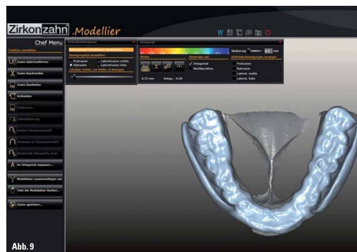
Abb. 9: Im Wizard werden die Durchdringungen abgeschnitten.

kuliert. Zur Vorbereitung werden im Bereich der Seitenzahnschilder im Oberkiefer die Flächen zur Schleimhaut bis zwei Millimeter zur Umschlagfalte ca. 0,5 Millimeter mit scanfähigem Wachs abgedeckt. Ebenso werden ab dem Eckzahn alle nach distal und interdental zeigenden Flächen ausgeblockt (Abb. 2). Bite Splint ist ein Zusatzmodul, welches sich in die Basissoftware einfügt. Schon bei der Erstellung des Auftrags sind die Unterpunkte für die Aufbiss-schiene auswählbar. Nach Aufforderung der Scan-Software werden die Modelle eingescannt (Abb. 14 und 15). Die Daten werden direkt zur Modellier- software übertragen. Zunächst schlägt das Programm eine Einschubrichtung vor. Der Benutzer hat die Möglichkeit, den Winkel entsprechend zu ändern, beispielsweise bei stark nach vestibulär geneigten Frontzähnen diese zurückzunehmen oder im Bereich der Molaren mehr