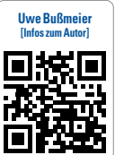
Uwe Bußmeier (Infos zum Autor)

titrierbaren Stangen zu fräsen. Das Einarbeiten einer Metallarmierung in einer PMMA-Schiene ist zzt. nur analog möglich und muss durch die Software- und Hardwareentwickler gemeinsam gelöst werden. Die Materialien entwickeln sich permanent weiter, hier ist das Ende noch lange nicht erreicht. Polycarbonate sind z. B. zwar elastisch, lassen sich aber nicht anpolymerisieren und sind auch nicht transparent. ZT