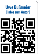
Uwe Bußmeier (Infos zum Autor)

titrierbaren Stangen zu fräsen. Das Einarbeiten einer Metallarmierung in einer PMMA-Schiene ist zzt. nur analog möglich und muss durch die Software- und Hardwareentwickler gemeinsam gelöst werden. Die Materialien entwickeln sich permanent weiter, hier ist das Ende noch lange nicht erreicht. Polycarbonate sind z. B. zwar elastisch, lassen sich aber nicht anpolymerisieren und sind auch nicht transparent. ZT