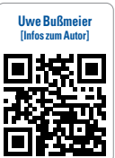
Uwe Bußmeier (Infos zum Autor)

titrierbaren Stangen zu fräsen. Das Einarbeiten einer Metallarmierung in einer PMMA-Schiene ist zzt. nur analog möglich und muss durch die Software- und Hardwareentwickler gemeinsam gelöst werden. Die Materialien entwickeln sich permanent weiter, hier ist das Ende noch lange nicht erreicht. Polycarbonate sind z. B. zwar elastisch, lassen sich aber nicht anpolymerisieren und sind auch nicht transparent. ZT