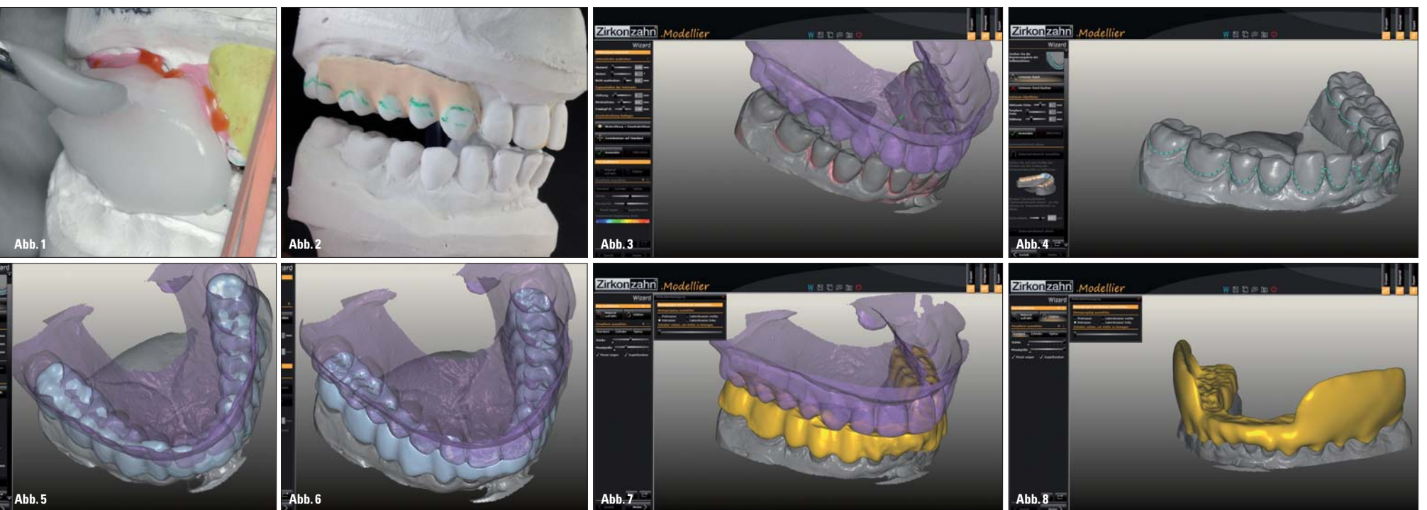
Abb. 1: Im Analog-Modus werden Seitenzahnschilder mit Autopolymerisat angetragen. – Abb. 2: Ausgeblokte Seitenzahnschilder vor dem Scannen. – Abb. 3: Die Einschubrichtung lässt sich individuell verändern, die Querschnitte werden angezeigt. – Abb. 4: Die gesetzten Punkte markieren den Schienenrand. – Abb. 5: Okklusal aufmodelliertes Material. – Abb. 6: Vom Programm okklusal abgeschnittene Durchdringungen. – Abb. 7: Der Antagonist wird optimal angepasst. – Abb. 8: Die Schilder werden im Bereich der zuvor ausgeblockten Fläche aufgebaut.

Als Beispiel sei hier die Software Bite Splint der Firma exocad in Kombination mit dem Scanner S600 ARTI von Zirkonzahn vorgestellt. Zunächst werden die Modelle mit der vorgegebenen Protrusionsbissnahme einarti-