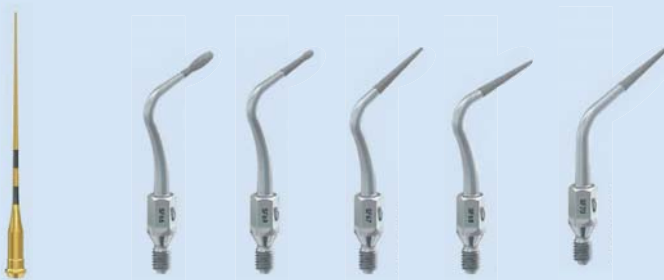
SF65.000.020 Schallspitze zur Aktivierung von Spülflüssigkeiten

Die Endo-Schallspitzen von Komet im Überblick: