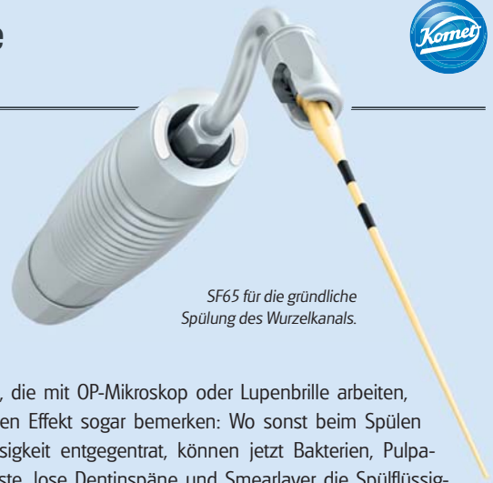
SF65 für die gründliche Spülung des Wurzelkanals.