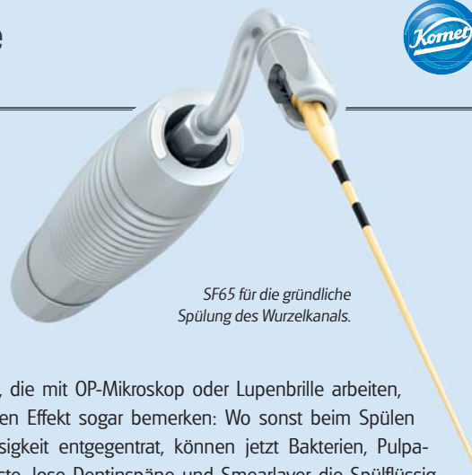
SF65 für die gründliche Spülung des Wurzelkanals.