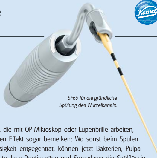
SF65 für die gründliche Spülung des Wurzelkanals.