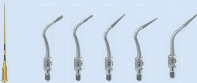
SF65.000.020 Schallspitze zur Aktivierung von Spülflüssigkeiten

Die Endo-Schallspitzen von Komet im Überblick: