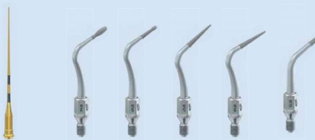
SF65.000.020 Schallspitze zur Aktivierung von Spülflüssigkeiten

Die Endo-Schallspitzen von Komet im Überblick: