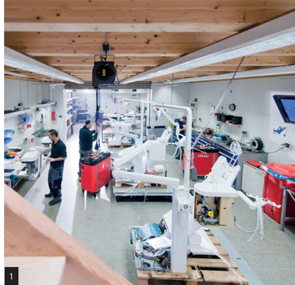
Abb. 1: Blick in die Pulheimer Dentalmanufaktur des Second Life-Anbieters rdv Dental. – Abb. 2a und b: Jede Einheit wird in ihre vollständigen Einzelteile zerlegt. Diese werden gereinigt, erneuert und neu zusammengesetzt. Abbildung b zeigt das Innere eines Speibeckens. – Abb. 3a und b: In der Pulheimer Donatusstraße sind im Showroom ständig rund 300 Behandlungseinheiten zu sehen. Jede Einheit kann individuell konfiguriert werden.

In diesem steht Dr. Buchmann jetzt und stellt erstaunt fest, dass die hier ausgestellten Einheiten in keinsten Weise gebraucht aussehen. Er schaut sich die Schläuche einer 20 Jahre alten Siemens M1-Einheit an und befindet den Zustand für einwandfrei – denn die ursprünglichen Schläuche waren spröde, hart und brüchig und wurden gegen neue getauscht. Er lässt sich das Arztelement sowie das Speibecken öffnen und findet nicht die kleinste Verunreinigung. Dies liegt daran, dass rdv Dental mehr bietet als nur eine „glänzende Fassade“, denn beim Ein-