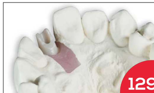
Individuelles Zirkonabutment, verklebt auf Titanbasis

inkl. MwSt., zzgl. Modelle, Versand und evtl. benötigter Implantattelle