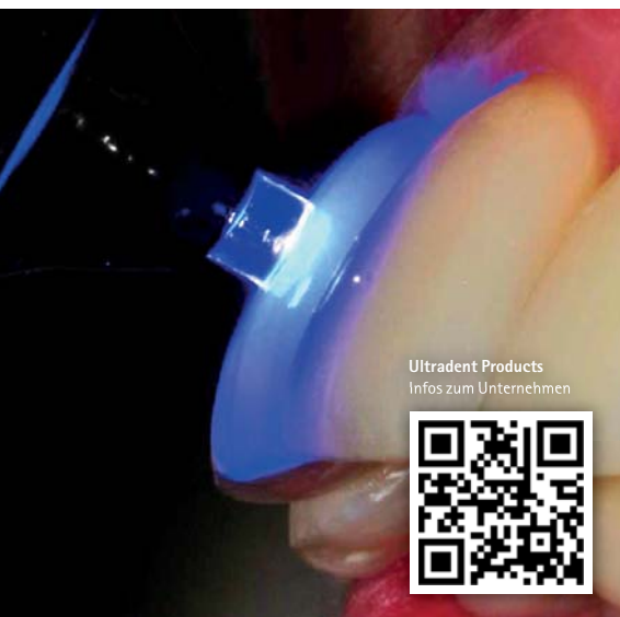
Abb. 4: Die PointCure Lens ist eine Punktlinse und dient dem „Anheften“ von Verblendschalen beim Befestigen sowie dem Beleuchten eines lichtleitenden Wurzelstiftes.

Innovative Produkte wie die VALO erleichtern nicht nur die tägliche Arbeit der Zahnärzte, sondern bieten dem Patienten eine zeitsparende, schonendere Behandlung. Die konsequente Weiterentwicklung der Technik hat damit auch positiven Einfluss auf die Patientenzufriedenheit und die Honorierung der zahnärztlichen Leistungen.