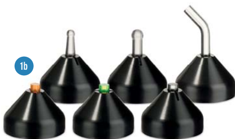
Abb. 1a und b: Sowohl die batteriebetriebene VALO Cordless als auch die VALO mit Kabel erzielen nicht nur bei der Lichtpolymerisation hochwertige Ergebnisse, sondern machen durch ihr umfangreiches Set an Linsen auch einen variablen Einsatz in anderen Behandlungssituationen möglich.

Die VALO ProxiCure Ball-Lenses sind in großer und kleiner Ausführung