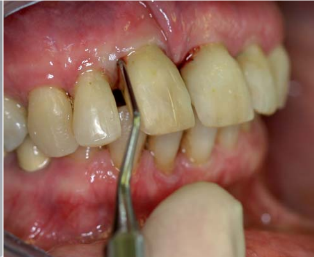
Abb. 5: Das Anfärben von Belägen zeigt mögliche Schwachstellen beim Putzen und hilft dabei, die Mundhygiene zu optimieren. – Abb. 6: Die subgingivale Instrumentierung sollte – entsprechend der Diagnostik – gezielt an vertieften Taschen erfolgen.