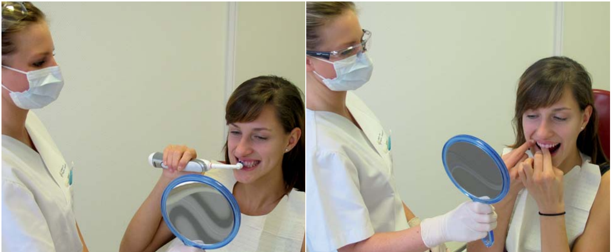
Abb. 2: Das häusliche Putzen muss eingeübt werden, etwaige Fehler lassen sich so korrigieren. – Abb. 3: Gleiches gilt auch für die Anwendung von anderen Hilfsmitteln, wie zum Beispiel Zahnseide.