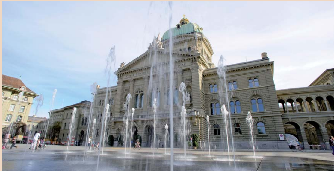
Der Gesellschaftsabend des Kongresses findet im Restaurant „Galeriedes Alpes“ im Bundeshaus statt.