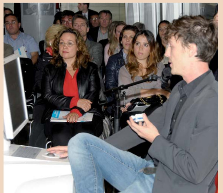
Zahlreiche Interessierte hörten spannende Fachvorträge.