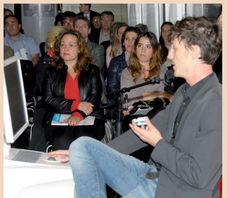
Zahlreiche Interessierte hörten spannende Fachvorträge.