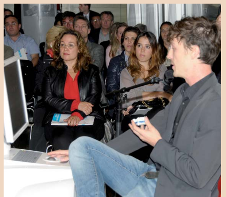
Zahlreiche Interessierte hörten spannende Fachvorträge.