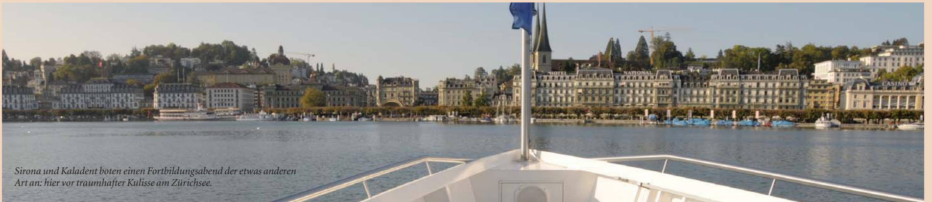
Sirona und Kaladent boten einen Fortbildungsabend der etwas anderen Art an: hier vor traumhafter Kulisse am Zürichsee.

Zürich-, Vierwaldstätter- und Thunersee sowie der Rhein liefern die Kulisse für das Boot-Event von Sirona und Kaladent.