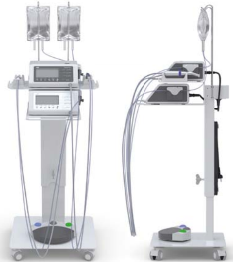
* Preis zzgl. ges. MwSt. Angebot gültig bis 31. Dezember 2014. Änderungen vorbehalten.

Mit den optionalen Koppellementen verbinden Sie die beiden perfekt miteinander harmonisierenden Steuergeräte auf minimalem Raum und erweitern damit die Möglichkeiten der Oralchirurgie.