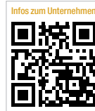
Infos zum Unternehmen

anzulegen oder Rechnungen online auszudrucken. Ab sofort kann der Käufer auch mit der Bezahlmethode „Kreditkarte“ sicher und bequem zahlen. Jeden Monat erscheinen neue exklusive Produktangebote oder besondere Onlineaktionen auf der Startseite des eShops. Zur Einführung übernimmt Straumann bis zum 31. Dezember 2014 die Standard-Versandkosten bei einem Bestellwert ab 250 Euro. Ein nach Meinung von Straumann guter Grund, die neue und bequeme Bestellmöglichkeit auf ihre Alltagstauglichkeit hin zu testen. Laut einer Studie der „Bitkom“ kaufen neun von zehn Usern online ein, vier von ihnen sogar regelmäßig. Danach ist Onlineshopping für Internetnutzer inzwischen kein Einzelfall mehr, sondern vielmehr zum Regelfall geworden. Mit seinem neuen eShop reagiert Straumann auf das veränderte Einkaufsverhalten sowie die Nutzung des Internets als Markt- und Warenplatz und folgt dem Bedarf und den Bedürfnissen seiner Kunden.