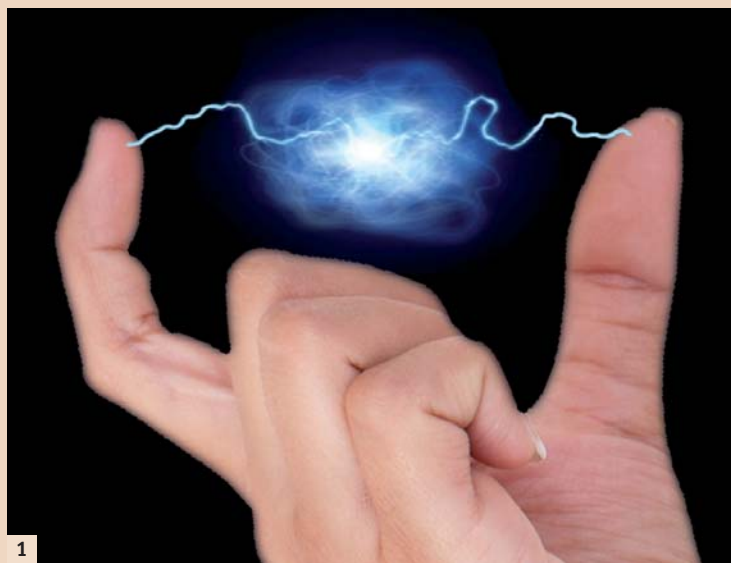
Abb. 1: Anschauliche Darstellung der Plasmawolke. – Abb. 2: Patientin mit FMT während der Full Mouth Disinfection.

Plasma ist ein Teilchengemisch auf atomar-molekularer Ebene, dessen Bestandteile teilweise oder vollständig in Atome, Ionen und Elektronen aufgeteilt sind. In der Medizin eingesetztes Plasma, abgekürzt TtP (Tissue tolerable Plasma), ist ein Cocktail mit Raumtemperatur, dessen Bestandteile teilweise über eine Ladung verfügen. Als Basisgas wird in der Medizin Umweltluft für CAP (cold atmospheric plasma), Argon oder reiner Sauerstoff mit 95 Prozent für COP (cold Oxygenplasma) eingesetzt. Für den Heilungsprozess ist dabei der Reinheitsgrad von entscheidender Bedeutung. So kann durch Smog belastete Umweltluft toxische Gase beinhalten und es demzufolge zu unspezifischen radikalischen Kettenreaktionen kommen. Der therapeutisch genutzte Konzentrationsbereich liegt in der Keimeliminierung und Wundreinigung bei 40 µg/ml bis zu 120 µg/ml, zur anschließenden Unterstützung des Heilungsprozesses bei nur noch 1 µg/ml bis 20 µg/ml. Höhere Konzentrationen hätten in der Heilungsphase eine zytotoxische Wirkung und würden die Epithelialisierung verhindern (Zerstörung der nachwachsenden Basalzellen). Zur systemischen Unterstützung des Heilungsprozesses ist nur CAP oder COP wirksam. Auch die Applikationszeit ist von ausschlaggebender