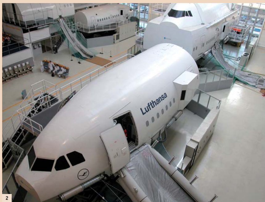
Abb. 2: Aus der Luftfahrt bekannt, für die zahnmedizinische Prophylaxe interessant: Schubspannung wirkt auf die Oberfläche eines umströmten Körpers, schafft aber eine effektive Plaqueentfernung nur bei Borstenkontakt. – Abb.3: Als entscheidend erweist sich, dass die durch die Borsten ausgeübten Scherkräfte die Adhäsionskräfte des Biofilms überwinden.